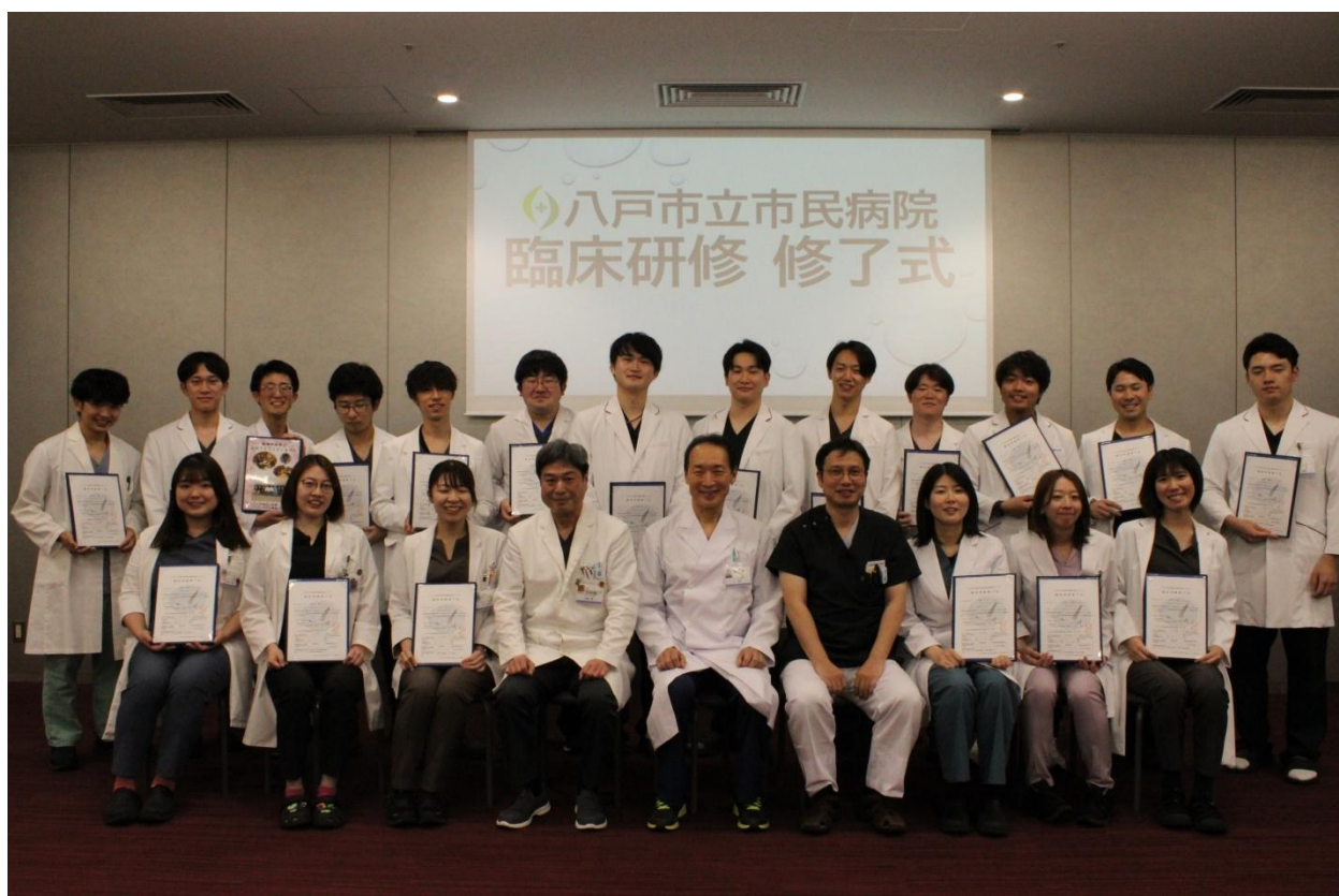
令和7年度研修修了 19名

弘前大学／東北大学／北海道大学／札幌医科大学／旭川医科大学／岩手医科大学／東北医科薬科大学／秋田大学／山形大学／福島県立医科大学／東京医科大学／東京慈恵会医科大学／順天堂大学／東京医科歯科大学／日本医科大学／昭和大学／日本大学／杏林大学／東京女子医科大学／帝京大学／千葉大学／埼玉医科大学／東海大学／北里大学／自治医科大学／獨協医科大学／群馬大学／筑波大学／新潟大学／信州大学／富山大学／金沢大学／金沢医科大学／福井大学／藤田保健衛生大学(藤田医科大学)／京都大学／京都府立医科大学／大阪医科大学／関西医科大学／鳥取大学／島根大学／岡山大学／広島大学／愛媛大学／徳島大学／高知大学／九州大学／産業医科大学／長崎大学／熊本大学／大分大学／宮崎大学／鹿児島大学／琉球大学／ペーチ大学(ハンガリー国立)／在プラハ・カレル大学